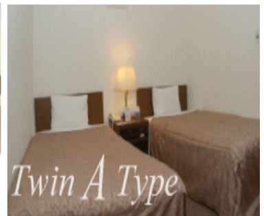
Twin A Type